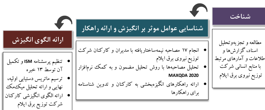
شکل ۱. مراحل پژوهش و اقدامات انجام‌شده

ابتدا با مطالعه اسناد و گزارش‌های سازمانی شرکت توزیع برق ایلام، به شناخت کلان سازمان پرداخته شد و وضعیت منابع انسانی این شرکت، مورد مطالعه و بررسی قرار گرفت. بدین منظور اسناد راهبردی، ساختار سازمانی، برنامه‌های رفاهی و انگیزشی، نظام پیشنهادات و آمار و اطلاعات کارکنان شرکت توزیع نیروی برق ایلام تحلیل شد. این شرکت در زمان انجام پژوهش دارای ۷۳۶ نیروی انسانی بوده است. خلاصه‌ای از یافته‌های این مرحله، در قسمت بعدی آمده است. سپس به منظور شناسایی عوامل مؤثر بر انگیزش کارکنان و ارائه راهکارهای بهبود، تعداد ۱۷ مصاحبه نیمه‌ساختاریافته با مدیران و کارکنان شرکت انجام شد. مصاحبه‌شوندگان با روش نمونه‌گیری هدف‌مند از میان مدیران و کارکنان شرکت انتخاب شدند. تلاش شد تا به شکل هدف‌مند آن دسته از مدیران و یا کارکنان برای مصاحبه انتخاب شوند که نشانه‌هایی از بی‌انگیزگی و یا انگیزش بالا در خود داشتند. داده‌های حاصل از مصاحبه با روش تحلیل مضمون و با استفاده از نرم‌افزار مکس کیودا ۲۰۲۰ تجزیه و تحلیل شد. در مصاحبه‌ها درخصوص جاذبه‌ها و دافعه‌های تأثیرگذار بر انگیزش افراد و نیز راهکارهایی که می‌تواند موجب ارتقای انگیزش آنان شود، سؤال پرسیده شد. فرایند مصاحبه‌ها با مدل هفت‌مرحله‌ای وال (۲۰۰۹) انجام شد که در جدول ۲ تشریح شده است.